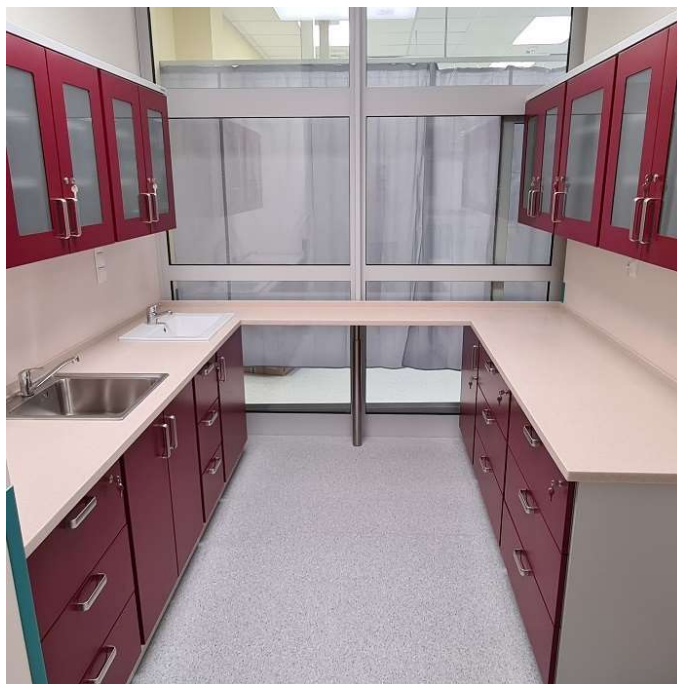
Przykładowe meble medyczne – źródło internet.

Uwaga: wszystkie zastosowane produkty specjalistyczne typu meble medyczne, urządzenia sanitarne medyczne itp. muszą posiadać atest PZH, znak CE, deklarację właściwości użytkowych oraz muszą być zgodne z wymaganymi normami i certyfikatami.