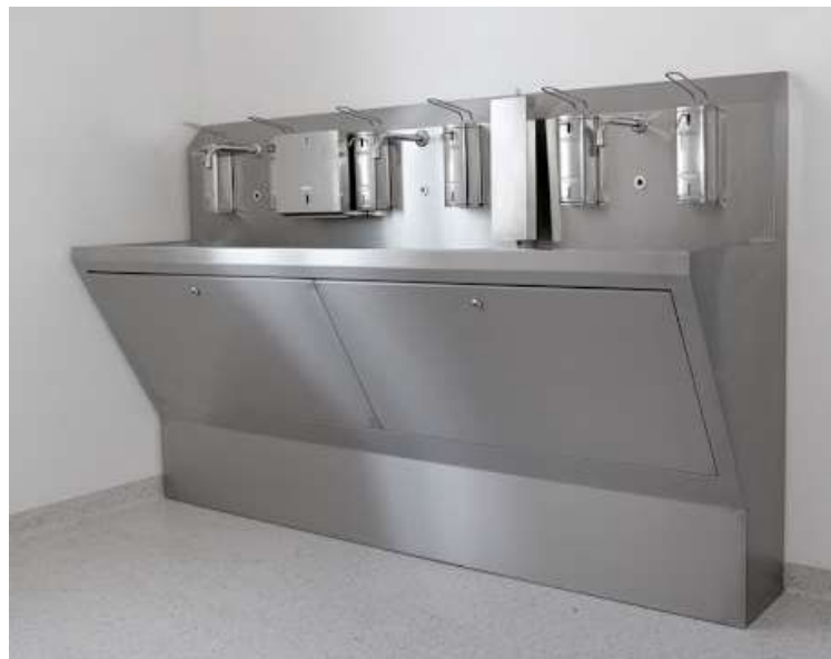
Przykładowa myjnia chirurgiczna

W pomieszczeniu przygotowawczym należy zamontować zlew dwustanowiskowy (każde stanowisko z oddzielną baterią ręczną) wykonany ze stali nierdzewnej.