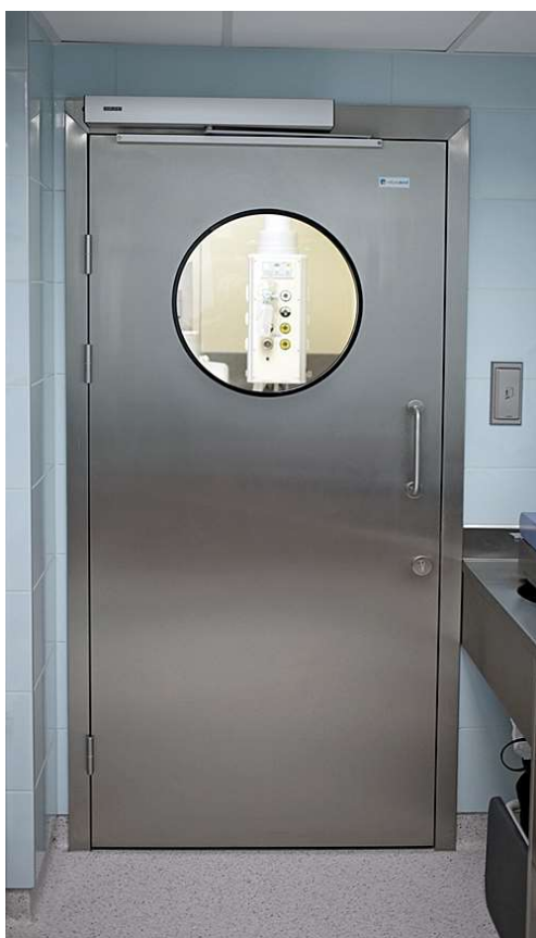
Przykładowe drzwi medyczne przejściowe z pokoju przygotowawczego do Sali operacyjnej.