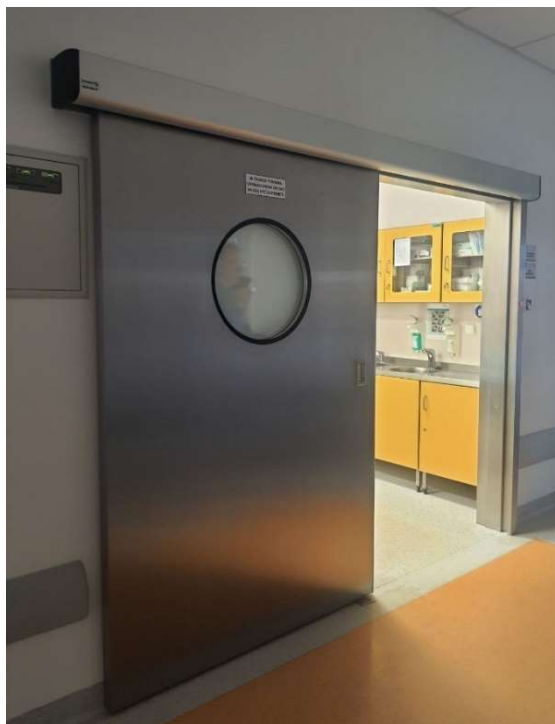
Przykładowe drzwi medyczne przesuwne główne wejściowe do pokoju przygotowawczego Sali operacyjnej.

W projektowanej czwartej Sali operacyjnej należy zamontować drzwi medyczne przesuwne wejściowe do pomieszczenia przygotowawczego Sali operacyjnej (drzwi do umywalni dla personelu medycznego Sali operacyjnej zostawić istniejące, bez zmian) oraz drzwi medyczne przejściowe z pokoju przygotowawczego do Sali i z umywalni do Sali. Drzwi oraz ościeżnice muszą być wykonane ze stali nierdzewnej o fakturze szlifowanej, okucia drzwi ze stali nierdzewnej. Drzwi te muszą mieć bardzo dobre właściwości termiczne i akustyczne przy jednocześnie lekkiej i sztywnej konstrukcji. Całość uzupełniona higieniczną uszczelką silikonową. Drzwi z funkcją automatycznego otwierania.