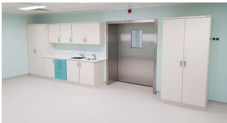
Przykładowe meble medyczne – źródło internet.