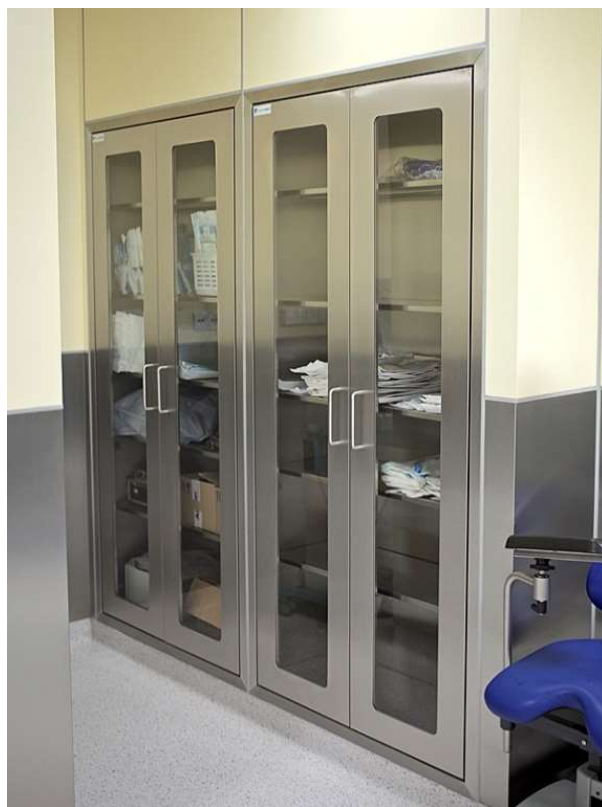
Przykładowa szafa medyczna