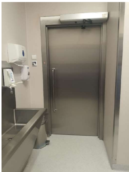
Przykładowe drzwi medyczne przejściowe z umywalni do Sali operacyjnej.